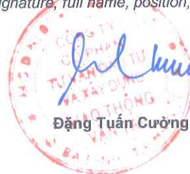
Đặng Tuấn Cường

(Ký, ghi rõ họ tên, chức vụ, đóng dấu) (Signature, full name, position, and seal)