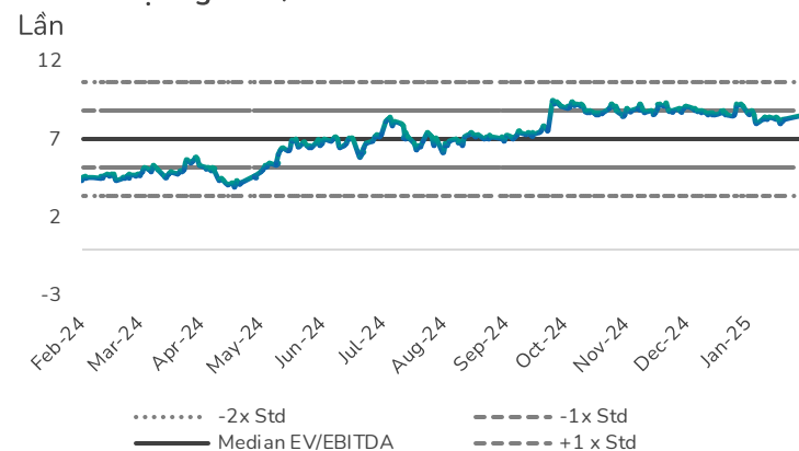
Hình 2: Định giá EV/EBITDA