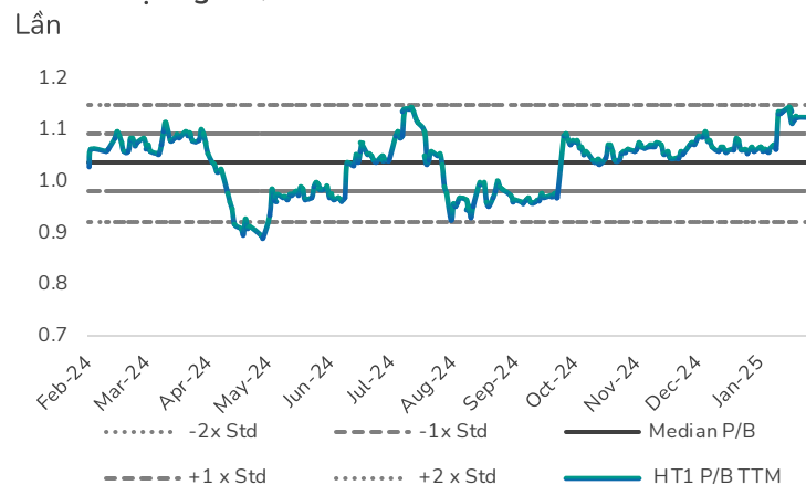
Hình 4: Định giá P/B