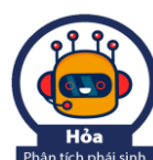
Hỏa Phân tích phái sinh

Trợ lý phân tích cơ bản (Mộc): cung cấp thông tin tổng quan về tình hình hoạt động của doanh nghiệp thông qua các biểu đồ và các chỉ tiêu tài chính.