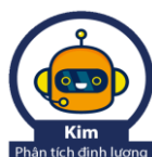
Kim Phân tích định lượng

BSC ibroker là dịch vụ 24/7 cung cấp cho khách hàng để hỗ trợ tra cứu thông tin, phân tích dữ liệu thị trường, dữ liệu cổ phiếu và đưa ra các tư vấn khuyến nghị đầu tư. BSC iBroker không thay thế khách hàng trong việc ra quyết định giao dịch; khách hàng nên xem xét BSC iBroker như một nguồn thông tin tham khảo.