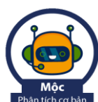
Mộc Phân tích cơ bản

Trợ lý báo cáo phân tích (Thuỷ): cung cấp báo cáo phân tích và khuyến nghị theo phân tích cơ bản từ các chuyên viên phân tích của Phòng PTNC – BSC.