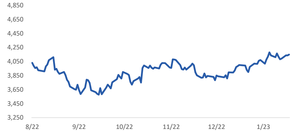
Diễn biến Shanghai Composite